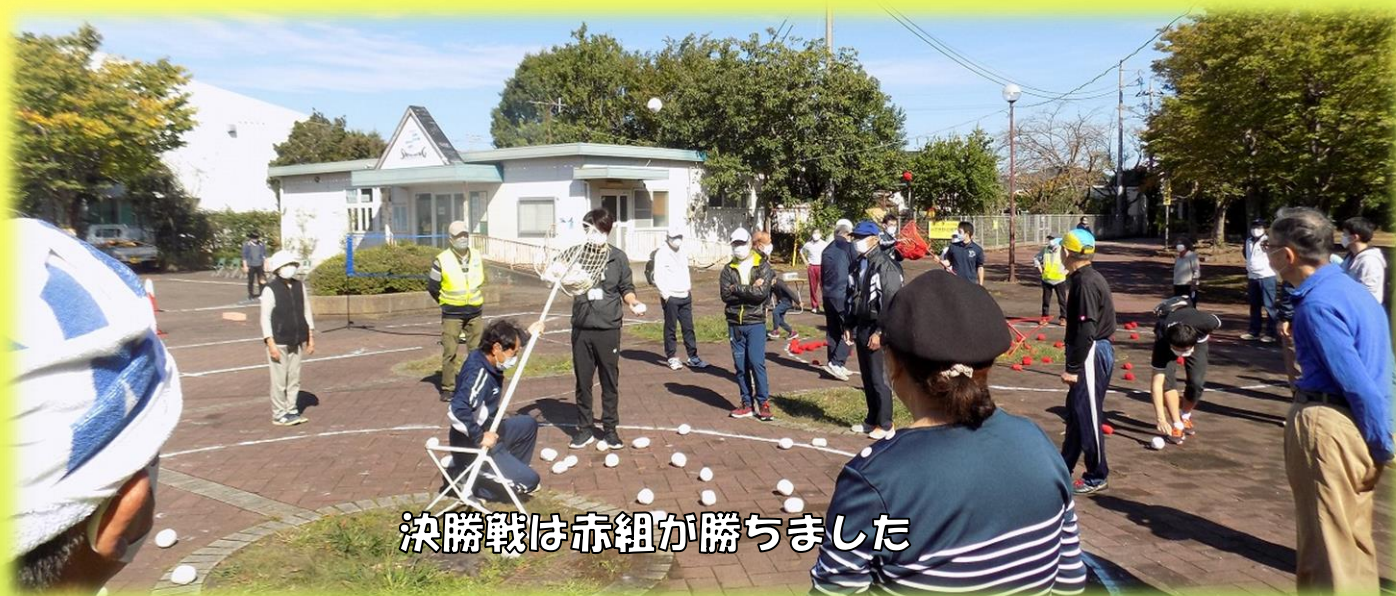
決勝戦は赤組が勝ちました