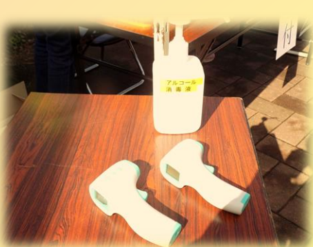
参加者全員：検温とアルコール消毒

競技を始める前に約70名の参加者全員でラジオ体操をしました。体操のあとは、玉入れを全員で3回戦を行い赤組が勝利しました。競技種目は玉入れの他は、体力測定・ペタンク・卓球・バトミントン・輪投げが準備されており、それぞれの競技で汗を流し頑張りました。競技は誰一人怪我することなく午前中で終了し、午後からは競技会場が懇親会会場になり楽しい時間を過ごしました。開催にあたり、コロナ対策は万全で参加者全員の検温、アルコール消毒、マスクを着用して競技を実施しました。このイベントを準備してくれた町内会役員をはじめとする多くの方々の協力の下に成り立っていることを感じました。