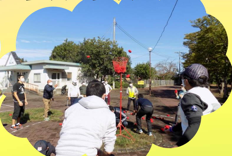
白組、赤組どちらも譲らず決勝戦へ