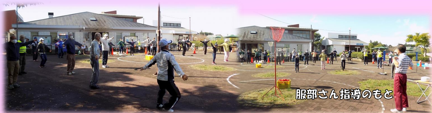
服部さん指導のもと