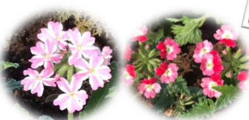
バーベナの仲間です。