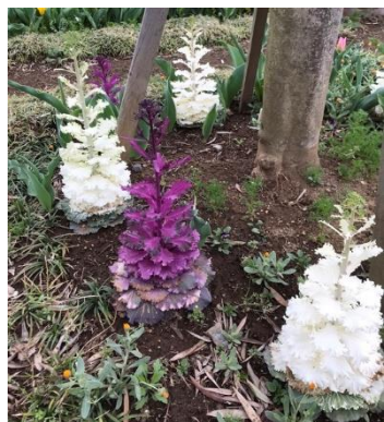
茎を伸ばしてきたハボタン。 まるでフランス人形のように？