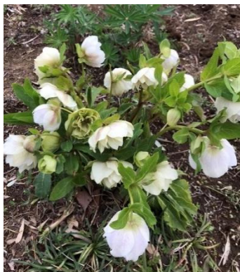
クリスマスローズ

3月 冬の間、色合いが寂しかったガーデンにチューリップが咲き始めて春の訪れを告げています。