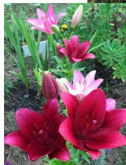
色とりどりのユリ