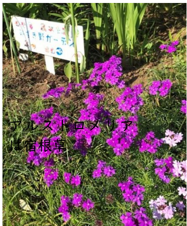
アルストロメリア 宿根草