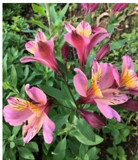
宿根草の アルストロメリア