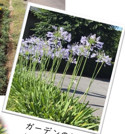
ガーデンの周囲を飾るアガパンサス