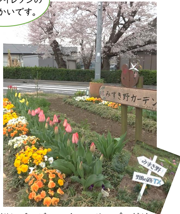
桜とパンジー、チューリップの競演の始まりです。

4月 パンジーもチューリップも満開となって春爛漫のガーデンです。紫色のライラックとブルーのジュウニヒトエも見逃せません。