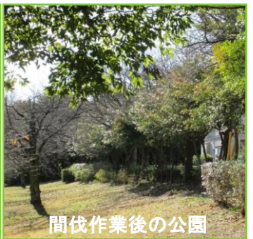
間伐作業後の公園