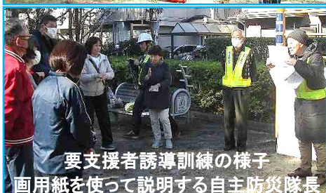
要支援者誘導訓練の様子 画用紙を使って説明する自主防災隊長