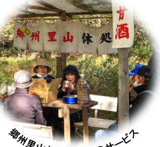
郷州里山お休み処甘酒のサービス