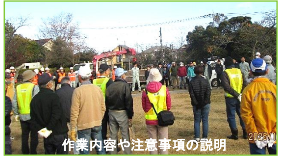
作業内容や注意事項の説明

当日は穏やかで暖かな日差しのもと作業が進められ、 一帯は見違えるほど見通しが良くなり、明るく きれいな公園となりました。早朝から作業 に参加いただいた皆様、大変お疲れ様 でした。そして、ご協力ありがとうございました。今回は剪定した枝葉をチップ化 する木材破砕機(ウッドチップパー)が使用 されその威力に参加者の皆様は驚かれていました。