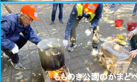
もものき公園のかまどベンチでの炊き出しの様子